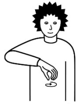
Wasser (aus Leitung oder Flasche)

https://www.tanne.ch/geste/wasser-aus-leitung-oder-flasche#/geste/wasser-aus-leitung-oder-flasche?video=1